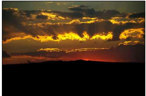
mon ciel fluo...

sur les rives acacias s'époumonent mes maux au parfum de fuchsias carillonnent coraux