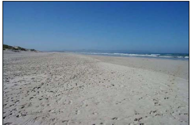
bleu de plage...

des prairies rousses coule et danse la rosée cœur de nuage