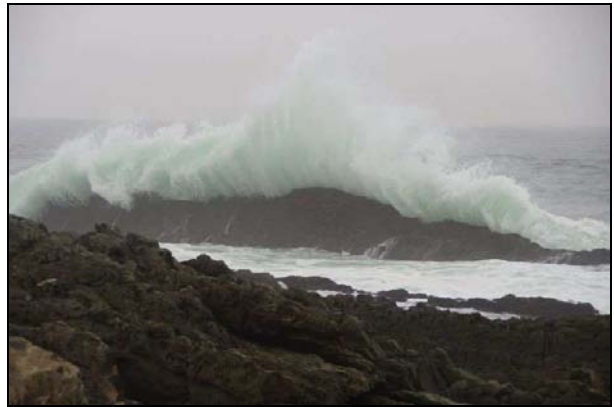
pas si vague...

et les vents taillent des tuiles Bakélite aux vers marins